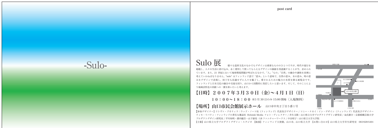
展覧会フライヤー (デザイン: 中谷昭子)