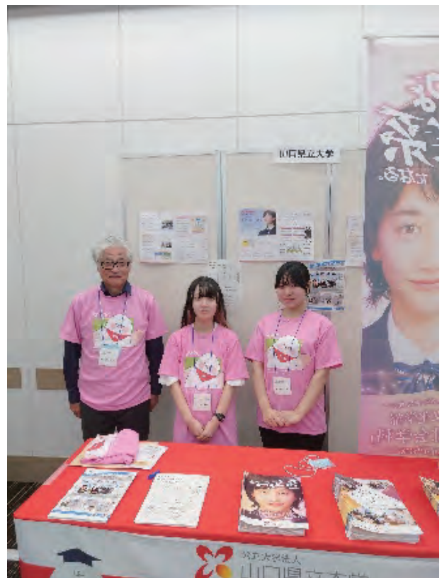
図4 長州デジタル人材PR事業