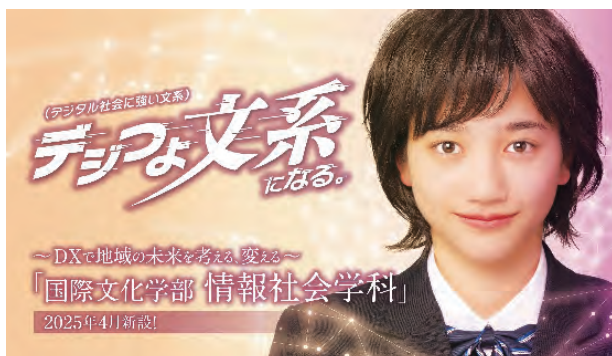
図1 学科の広告(大学サイトより)

新学科は、「デジタルに強い文系」、略して「デジつよ文系」というキャッチコピーが作られ、広報が展開されていくことになった(図1)。リーフレットから、ラッピングバス、YouTubeやテレビでの広告などという手段も含めた大量の広告が出された (12) 。問題は、新学科が学生にどのような能力を身につけさせるか、具体的には免許・資格等で取得できるものを確定していく必要がある、ということだった。「情報I」の教員免許は教育の中で取得することができるように準備していくことができたが、国際文化学科における語学検定や日本語教員資格 (13) 、文化創造学科における司書や学芸員資格のようなものが、新学科の場合どう打ち出せるかということが問題となった。準備会議で分かってきたのは、情報関係の高度な免許・資格を大学で出せるようにするには、さらに理科系色を強めなければ