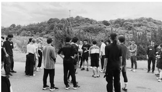
写真1 5大学サバイバルキャンプ

探検部は、部活動のような競技性や固定的な活動体系を前提とするものではなく、自然環境を活用した探検的・野外体験的な活動を柔軟に行う学生サークルとして位置づけられる。主な活動は山登りを中心としつつ、釣りや野外生活技術、簡易なサバイバル体験など、参加者の関心や経験に応じて内容を調整してきた。以下、探検部の設立の経緯と趣旨について述べる。