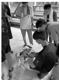
写真2 広島大学探検部員による魚捌き講習