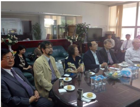
2015年旧永達技術学院校舎利用の試み

この取り組みは2015年5月に日本の免税品企業の経営者の店舗展開について具体的な提案を受けて、周南地区に店舗を誘致する取り組みが可能ではないかと模索しており、徳山商工高校を拠点に様々に想定できる取り組みができるのではないかと思う。