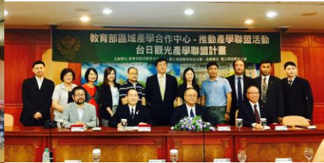
台日観光論壇(2016年10月開催)