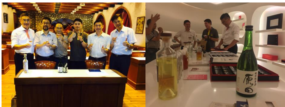
日本酒売り込み事前打ち合わせ(2016年6月)

2016年度に高雄市と周南市の交流として日台湾観光論壇を相互に開催した。高雄での開催は教育部補助及び周南市の予算による開催であり、周南市での開催は教育部の補助で実施された。