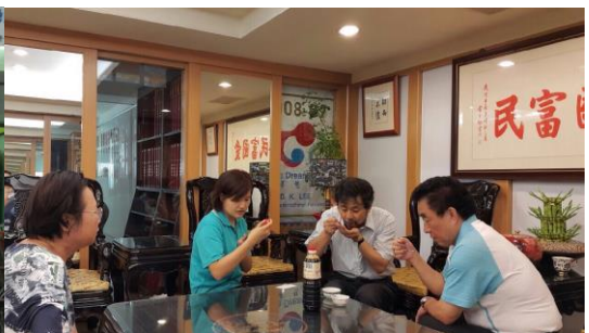
2015年度 防府市の醤油の売り込み スーパー売り込み