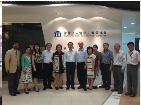
經濟部(省)所管の高雄港埠頭借り受けの試み