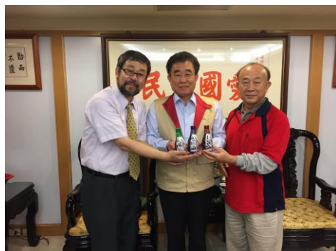
2016年度 醤油売り込み

交流の実績は2014年度から続くものであり、ぜひ実現したいと思う。商業教育の実践の場としてはきわめてよいつながりであると考えられる。