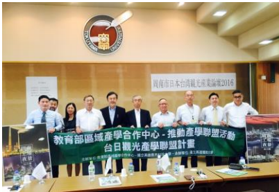
日台観光論壇(2016年7月開催)