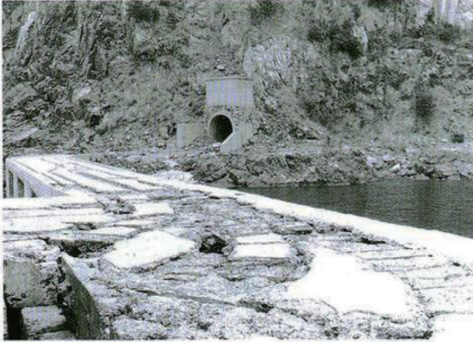
写真-9 改修前のトロッコ跡 15)

活用という点から見れば、この方法も許容できるものと考え、全体 100 件の内、先の○とこの□を合わせた件数 61 件、つまり約 6 割の遺産が何らかの有効活用がなされている状況であると言える。