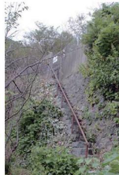
写真-8 大津島幼・小・中学校内に残る 兵士訓練用階段跡