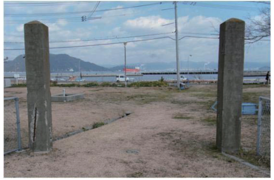
写真-4 魚雷調整工場門柱