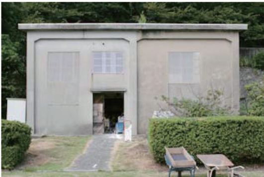
写真-7 大津島幼・小・中学校内に残る変電所跡