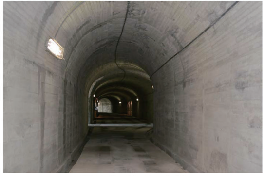
写真-2 トンネル内部