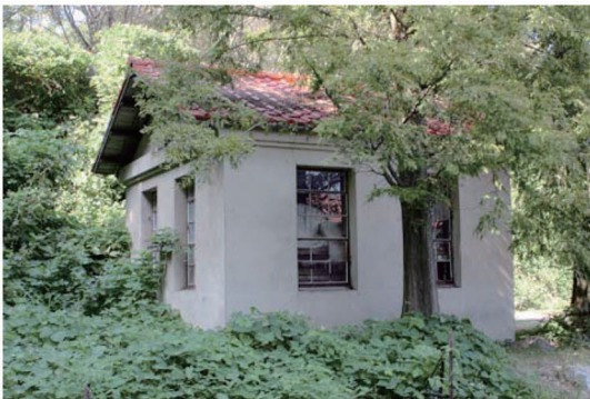
写真-5 大津島幼・小・中学校内に残る点火試験場跡