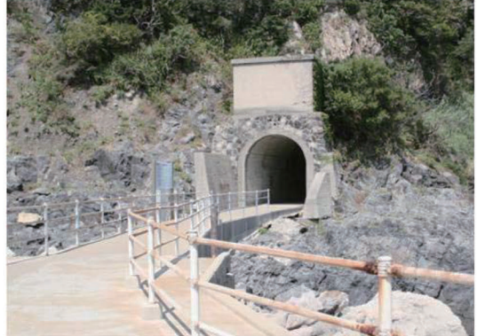
写真-10 改修後の様子

このような理由での過度の改修は、正確な歴史事実を後世に伝えることができないのみならず、オーセンティシティの確保という観点からも問題であると考えられる。このように機能性のみを重視した保存方法をしないためにも、的確な保存活用方法を選択することが必要である。