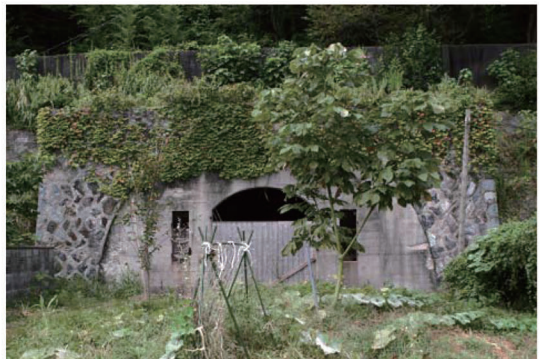
写真-6 大津島幼・小・中学校内に残る危険物貯蔵庫跡