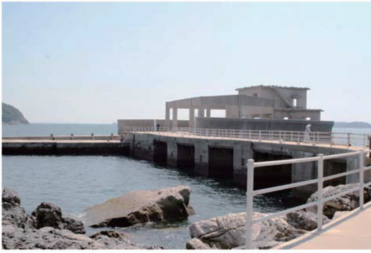
写真-1 回天発射訓練基地跡