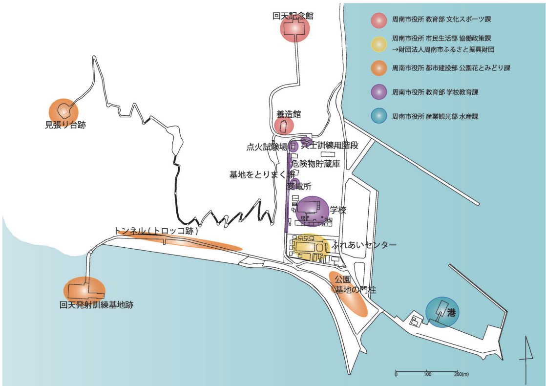
図-2 大津島戦争遺産現状図

兵舎や魚雷調整工場（点火試験場跡（写真-5）、危険物貯蔵庫跡（写真-6）、変電所跡（写真-7）、兵士訓練用階段（写真-8）を含む）があった部分の大部分には、現在は大津島幼・小・中学校と大津島ふれあいセンターがあり、これらの管理状況については、学校は周南市役所教育部学校教育課が管理者であり、ふれあいセンターは周南市役所市民生活部共同政策課が財団法人周南市ふるさと振興財団に管理を委嘱している。