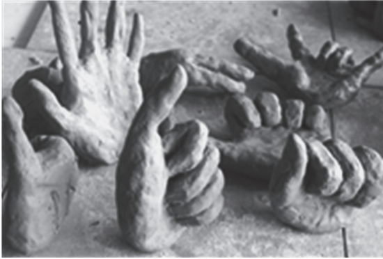
写真1 土粘土制作「手」

があるなど、造形素材としての土粘土は他の幼児の発達に望ましい材料の一つであるため、幼児の造形活動同様、泥遊び活動からさせることで、少しでも土粘土の特性を理解してもらうためである。授業課題としては「手」(写真1)と「顔」のデッサンを基に2～3回にわたり制作し立体感の把握と表現力技術の習得を目的に、立体表現作品として提出させてい