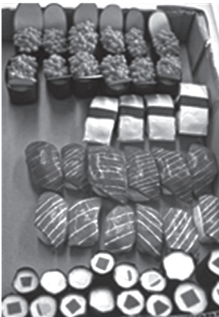
写真2 紙粘土「すし屋さん」

る。提出後は採点し、制作終了後の粘土は陶器の甕に水分を与えながら保存して再利用している。制作した学生にとっては甕に戻されることがむなしく思うものもある。また土粘土以外の粘土について「図画工作」授業では行っていないのが現状である。現場に密接な内容の「造形表現」授業内では平面による作業が大半を占め、2年次の選択授業「図画工作Ⅲ」での「お店屋さん」ごっこ授業時に一部の学生が、紙粘土を使用して食べ物を作成して園児たちに喜ばれ