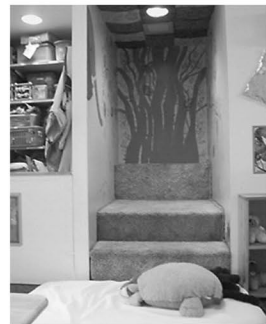
6 乳児2 階段部屋