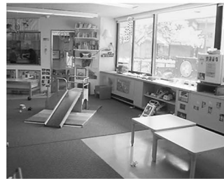
3 乳児2 保育室