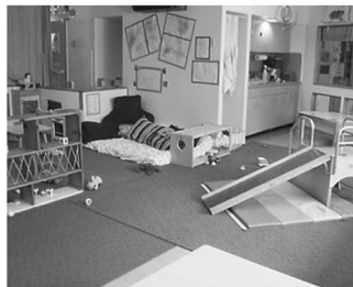
5 乳児2 保育室