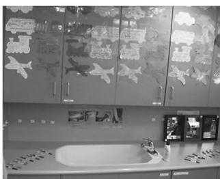
43 歯ブラシが並ぶ洗面台