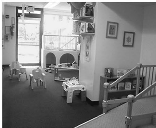
2 乳児1 保育室