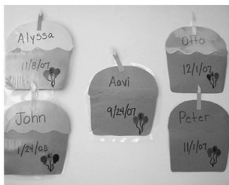
7 乳児2 プロフィール