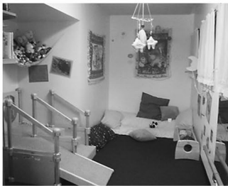
1 乳児1 保育室