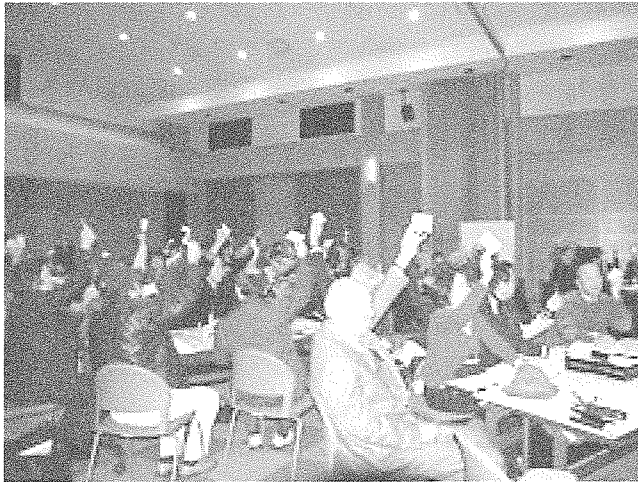
ワークショップへの積極的な参加