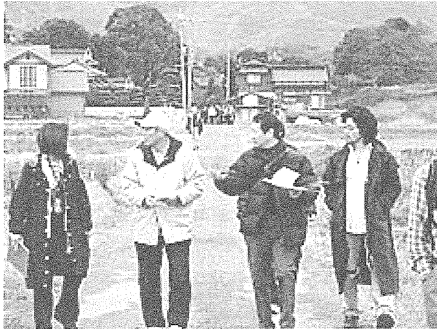
豊浦地区のフィールドワーク「地域資源発掘ツアー」