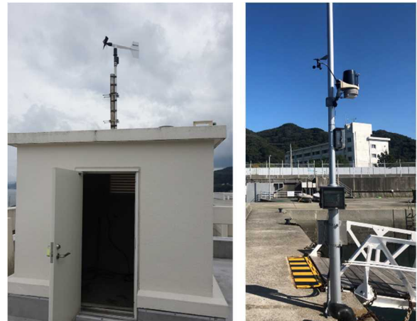
図 2 設置機器 左①小松 右④すばる