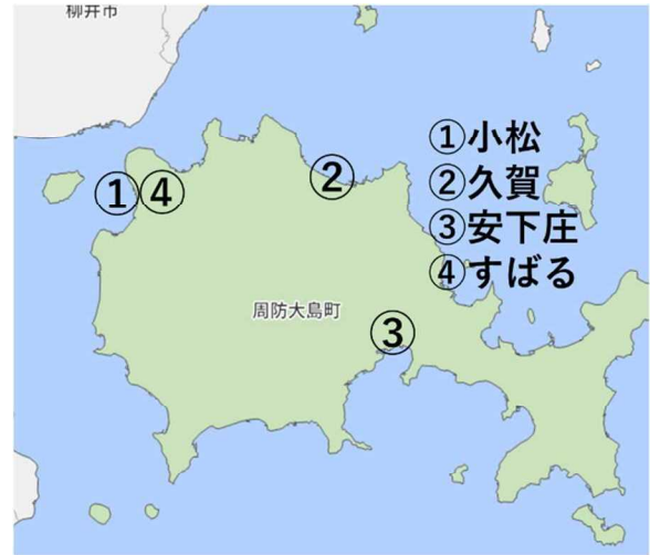
図 1 観測地点位置図

観測値の収集期間は 2019 年 5 月からの 5 ヶ月間、各観測地点からデータの収集を行った。