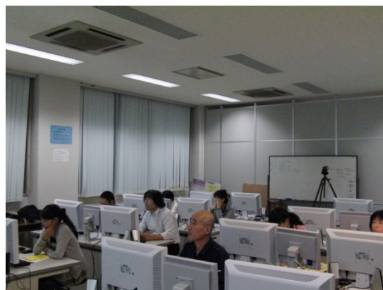
図1 Web・動画クリエイター養成(空)コースの授業風景