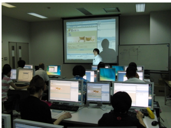
図1にWeb・動画クリエイター養成(空)コースの授業風景を示す。授業は主にコンピュータを用いた実習となる。実習は、講師が講師専用のコンピュータで操作した様子をプロジェクタや受講者のそばにあるモニター専用のディスプレイと前方の大型スクリーンに映し、随時説明を加えながら行う。この時、4名程度の補助スタッフが受講者の様子を見守り、操作に戸惑ったり、誤っていたりする場合にはすぐに援助するようにしている。