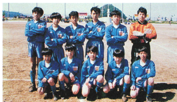
写真 2. 清水 FC

そんな清水 FC をかつて監督として率い、清水エスパルスで活躍した長谷川・堀池・大榎をはじめ多くの Jリーガーを教え子に持つのが前述した清水市の綾部美知枝氏であった。綾部氏は、サザン・セト大会を企画した当初に幾度となく大島を訪れ、大会運営に関する行政へのアドバイスや地域住民への講演会を行い、サッカーを通じた町づくりを提案している。そして大会に特徴をもたせるため、綾部氏の推薦で清水 FC の参加が実現したのである。